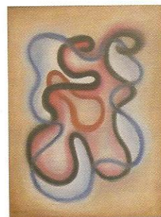
Engel-Pak, 1928 huile sur toile, 79,4 x 56 cm.